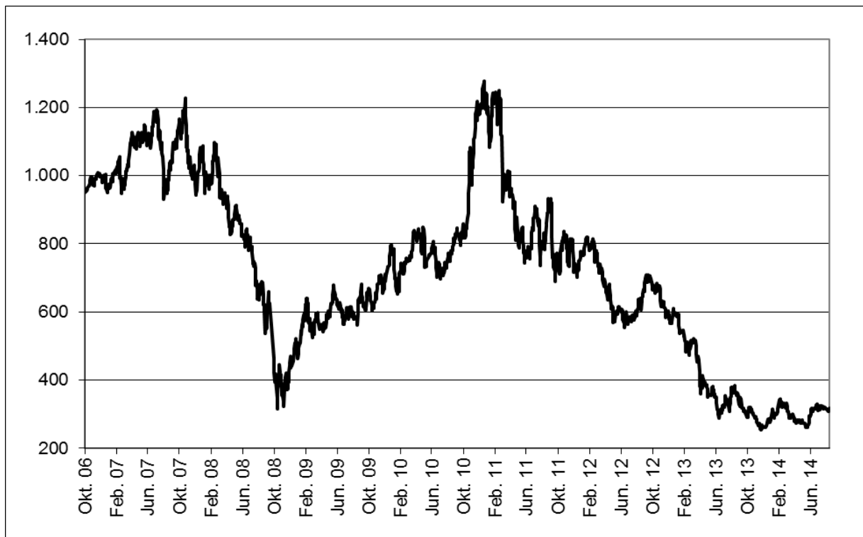
Abb. 1: Wertentwicklung unter Einbeziehung aller fondsinternen Kosten sowie des Ausgabeaufschlages bei Erstanlage. Individuelle Kosten wie Depotgebühren sind nicht berücksichtigt. Unter Einbeziehung dieser Kosten würde die Wertentwicklung niedriger ausfallen. Berechnet gemäß Bundesverband Investment und Asset Management e.V. (BVI).