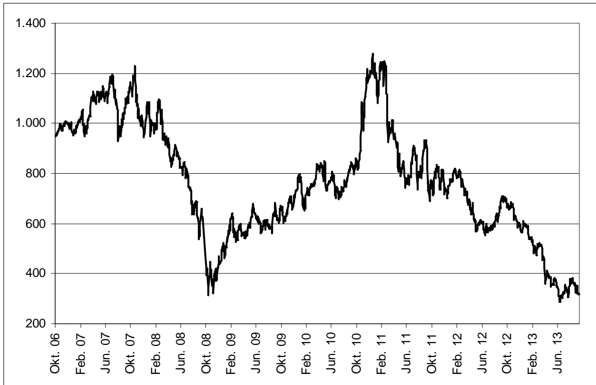
Abb. 1: Wertentwicklung unter Einbeziehung aller fondsinternen Kosten sowie des Ausgabeaufschlages bei Erstanlage. Individuelle Kosten wie Depotgebühren sind nicht berücksichtigt. Unter Einbeziehung dieser Kosten würde die Wertentwicklung niedriger ausfallen. Berechnet gemäß Bundesverband Investment und Asset Management e.V. (BVI).