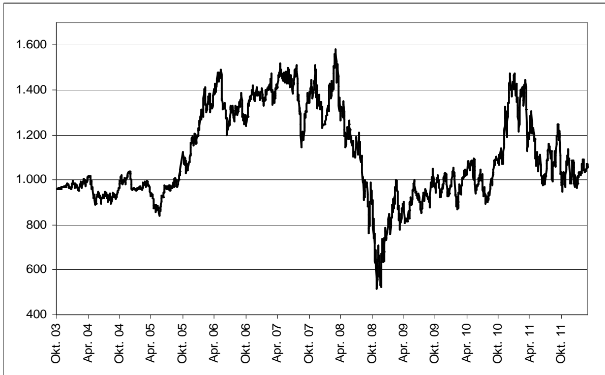
Abb. 1: Wertentwicklung unter Einbeziehung aller fondsinternen Kosten sowie des Ausgabeaufschlages bei Erstanlage. Individuelle Kosten wie Depotgebühren sind nicht berücksichtigt. Unter Einbeziehung dieser Kosten würde die Wertentwicklung niedriger ausfallen. Berechnet gemäß Bundesverband Investment und Asset Management e.V. (BVI).