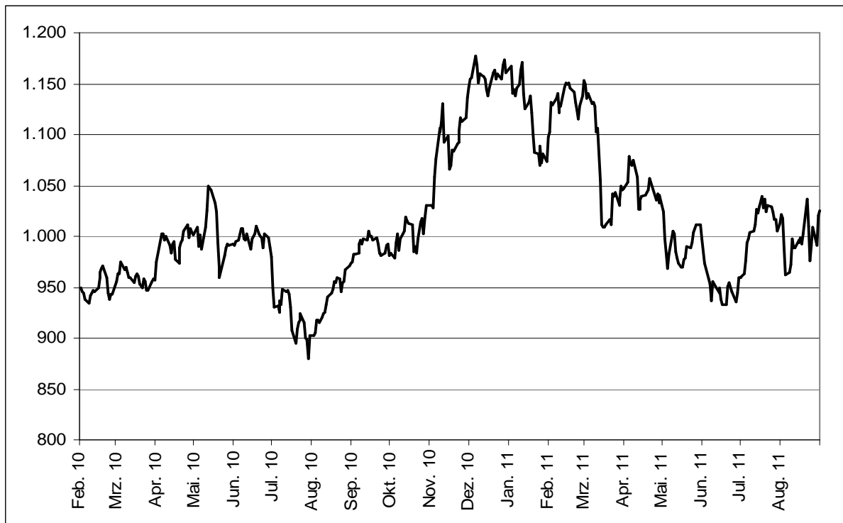
Abb. 1: Wertentwicklung unter Einbeziehung aller fondsinternen Kosten sowie des Ausgabeaufschlages bei Erstanlage. Individuelle Kosten wie Depotgebühren sind nicht berücksichtigt. Unter Einbeziehung dieser Kosten würde die Wertentwicklung niedriger ausfallen. Berechnet gemäß Bundesverband Investment und Asset Management e.V. (BVI).