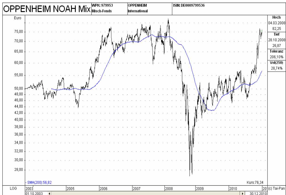
Abb. 1: Kursentwicklung des NOAH-Mix OP (979 953) von 01.10.2003 bis 31.12.2010

Das Sondervermögen NOAH-Mix OP weist aufgrund seiner Zusammensetzung eine erhöhte Volatilität auf, d.h. die Anteilspreise können auch innerhalb kurzer Zeiträume erheblichen Schwankungen nach oben und nach unten unterworfen sein. Zu den Risiken zählen insbesondere Adressausfall-, Zinsänderungs-, Währungs- sowie sonstige Marktpreisrisiken, operationelle Risiken und Liquiditätsrisiken.