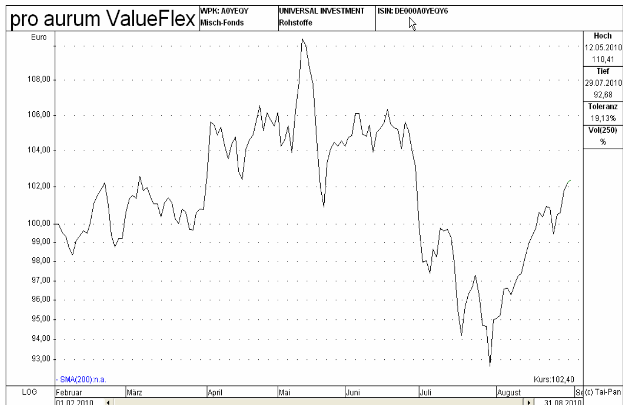
Abb. 1: Kursentwicklung des pro aurum ValueFlex (A0YEQY) von 01.02.2010 bis 31.08.2010

Das Sondervermögen pro aurum ValueFlex weist aufgrund seiner Zusammensetzung eine erhöhte Volatilität auf, d.h. die Anteilspreise können auch innerhalb kurzer Zeiträume erheblichen Schwankungen nach oben und nach unten unterworfen sein. Zu den Risiken zählen insbesondere Adressausfall-, Zinsänderungs-, Währungs- sowie sonstige Marktpreisrisiken, operationelle Risiken und Liquiditätsrisiken.